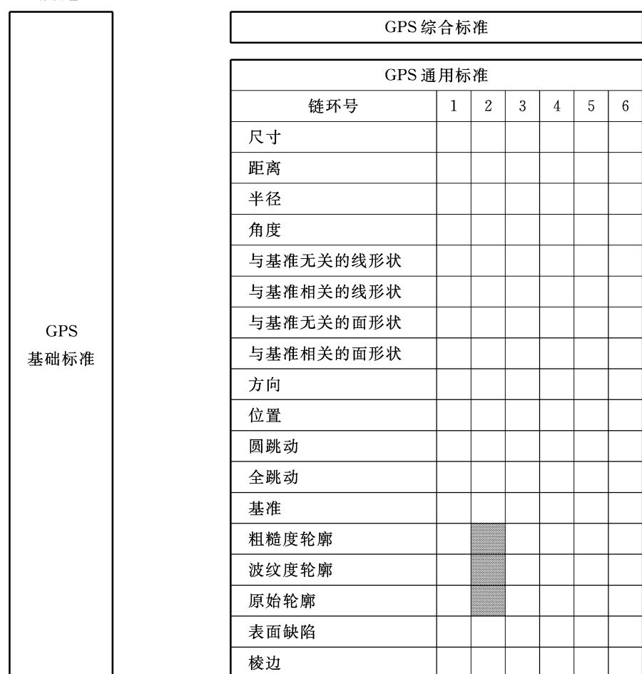
图 D.1 在 GPS 矩阵模型中的位置

本标准是 GPS 通用标准,它影响 GPS 通用标准矩阵中粗糙度轮廓、波纹度和原始轮廓标准链的链环 2,如图 D.1 所述。